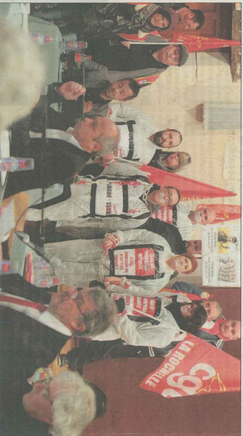
C'était le 16 février. Des agents territoriaux CGT manifestaient lors de la réunion du Conseil municipal.

M'a pas manqué de constater, en voyant défiler des groupes de jeunes gens déguisés aux Minimes et sur le Vieux Port, que la saison des journées d'intégration battait son plein sur le campus. Hier, les étudiants de l'UT optèrent ainsi pour une course d'orientation en tenue bigarrée, avec photos à l'appui à chaque étape. Autre ambiance au Lycée hôtelier, mercredi soir, où un buffet à base de produits régionaux (farci poitevin, huîtres, caramiel au beurre salé...) était proposé aux nouveaux BTS. Chacun son style.